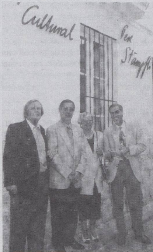
El 23 de setembre de 1995 inauguració del local del GES en l'Espai Cultural Pere Stämpfli

Deixeu-me recordar ara unes dates significatives per a la nostra associació. El 22 de juny del 1975, en un escrit publicat per Ramon Planes a l'Eco, a la secció Carnet del Caminant, que ell signava amb el pseudònim de Tirant, Planes feia una crida a la creació a Sitges d'un Centre d'Estudis, seguint així l'exemple d'altres poblacions de Catalunya. El dia 26 de setembre, després d'unes converses prèvies amb altres interessats, hi hagué una primera reunió a la Biblioteca Popular Santiago Rusiñol. I el 14 d'octubre d'aquell mateix any es constituí oficialment el Grup d'Estudis Sitgetans.