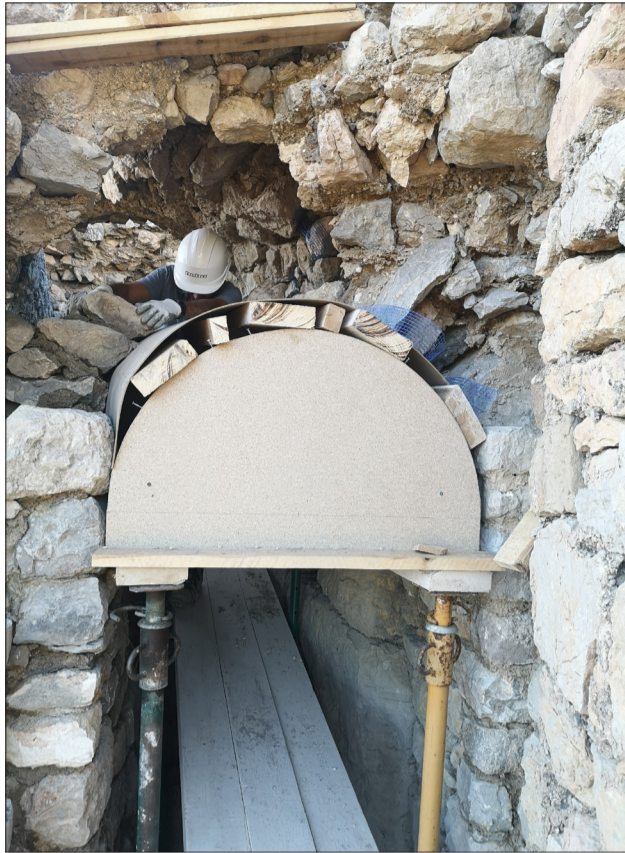
↑ Porta d'accés durant el procés de treball.