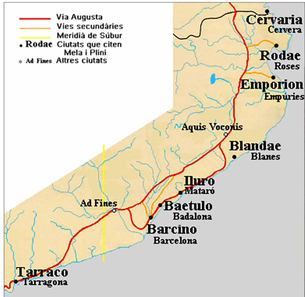
↑ Situació, a la costa i en el recorregut de la via Augusta, de 8 ciutats conegudes de les 10 que esmenten Mela i Plini.

rigues, L'Arboçar, Canyelles, Ribes i acaba al mar una mica l'est de Vilanova. És a dir, passa pel Penedès.