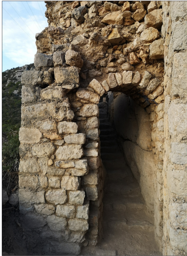
↑ Final dels treballs a la porta del Castellot.

dos orificis rectangulars que servien per col·locar les dues tranques per enfortir la porta de fusta d'accés per la seva part interior.