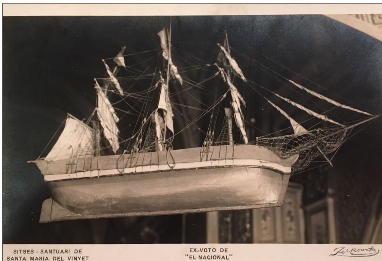
↑ Maqueta naval del bergantí el «Nacional».

Fou una de les maquetes de vaixells que es van perdre com a conseqüència de les destrosses de juliol del 36 ja esmentades. Cal comentar-la per la importància que presenta en tant que