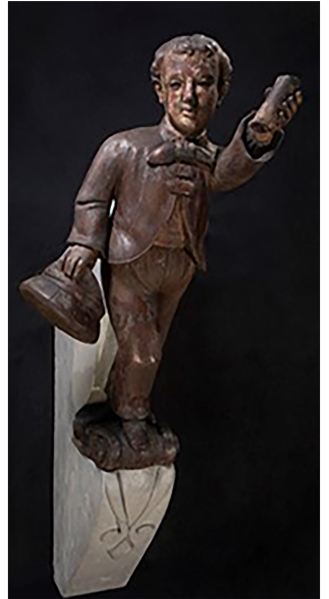
↑ Els mascarons de proa Blanca Aurora i el Ninot . (Museu Marítim de Barcelona)

gaven al litoral català, que va disposar de més feina. Molts mascarons de diferent temàtica van sortir de les seves mans en tota mena de vaixells. S'observa que els rostres de les imatges representades per aquest artista no distingien els encàrrecs de temàtica religiosa dels de temes profans.