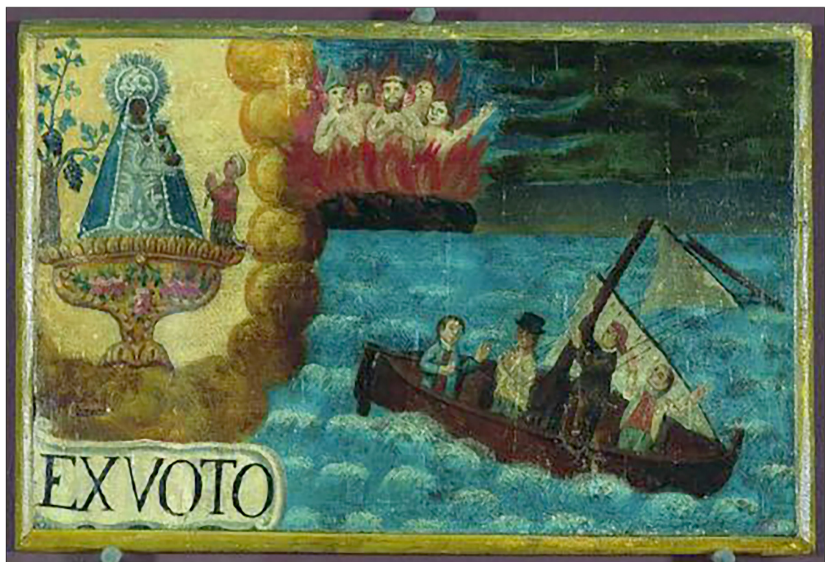
↑ Retauló d'una barca desarborada amb la seva tripulació a bord. Col·lecció del Santuari del Vinyet de Sitges (Museu Marítim de Barcelona).