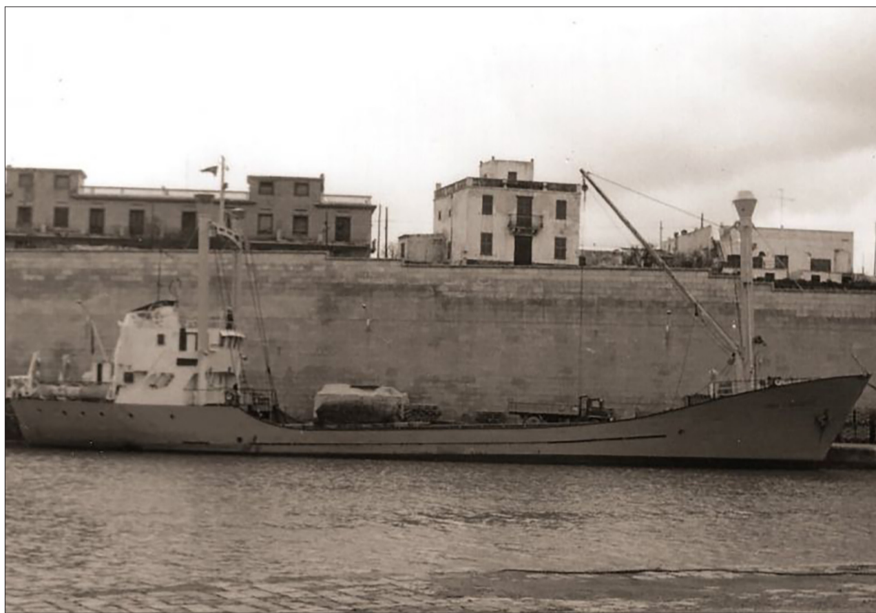
↑ El vaixell de càrrega Sonia Gema Masiques , al port de Ciutadella l'any 1970.

L'any 1957 en la campanya de recuperació de les restes del Vasa , vaixell de l'Armada Reial Sueca i icona de l'arqueologia naval, que va naufragar el dia de la seva inauguració, el 10 d'agost del 1628, els arqueòlegs no van trobar cap moneda en la base del pal major. La localització del Vasa es portà a ter-