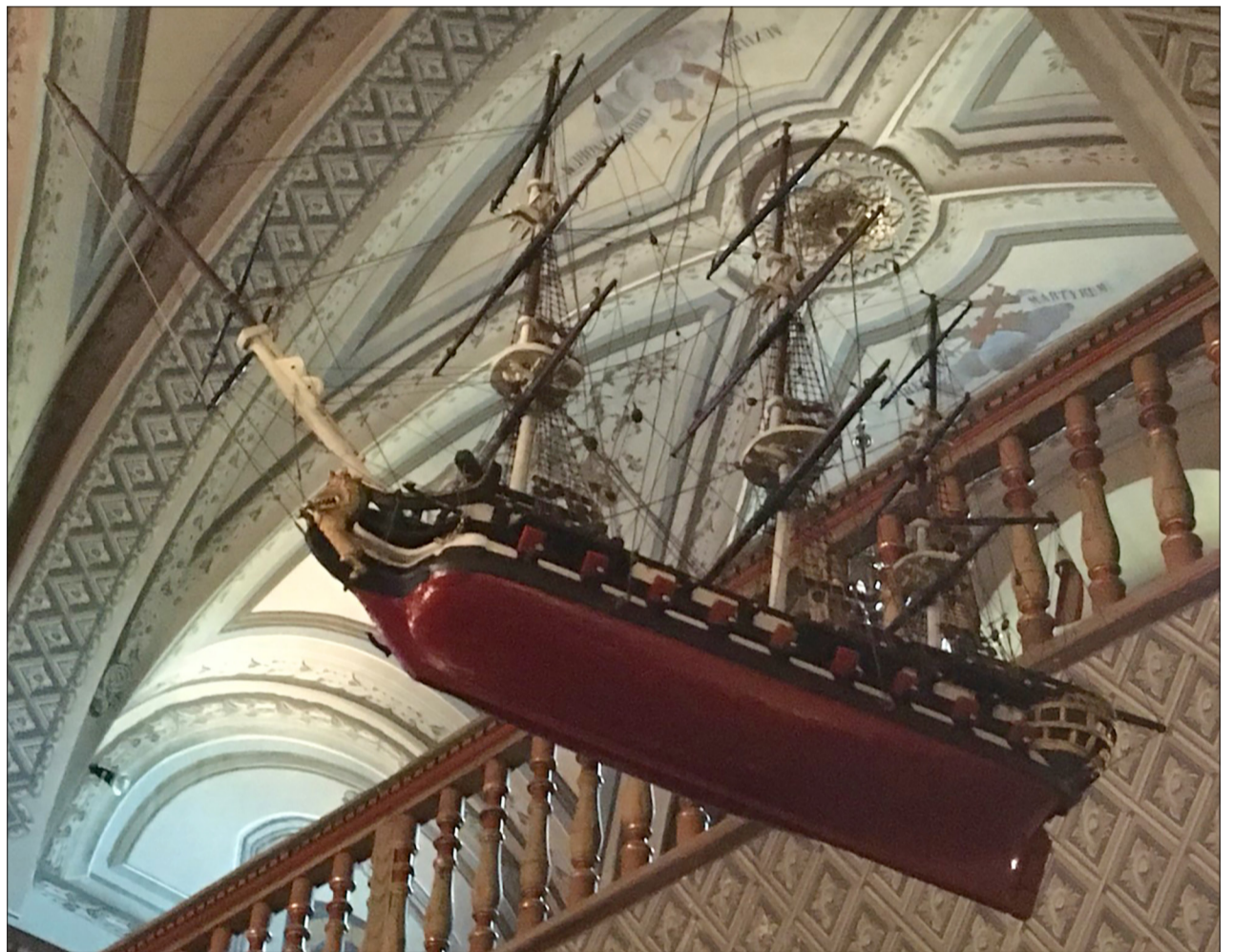
Maqueta naval d'una fragata de guerra de la Real Armada, segle XVIII. (Santuari del Vinyet, Sitges)

Objectes i fets: paraigües oberts; portar posades les sabates d'anar pel carrer; flors; girar una escombra cap per avall; deixar a bord mitja ceba tallada; vessar sal d'un flascó; xiular. Es creia que el fet de xiular despertava vents incontrolables i els mateixos dimonis. Les flors es reservaven per retre homenatge als mariners morts.