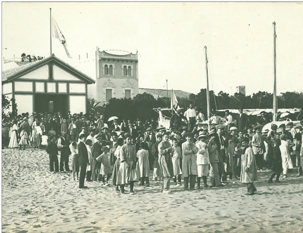
↑ Inauguració i benedicció del bot i caseta de salvament de Sitges.

Abans a Espanya els batejos de les naus es solemnitzaven amb cerimònies pròpies de la tradició catòlica: el mossèn amb l'hisop aspergia aigua beneïda a ambdós costats de la