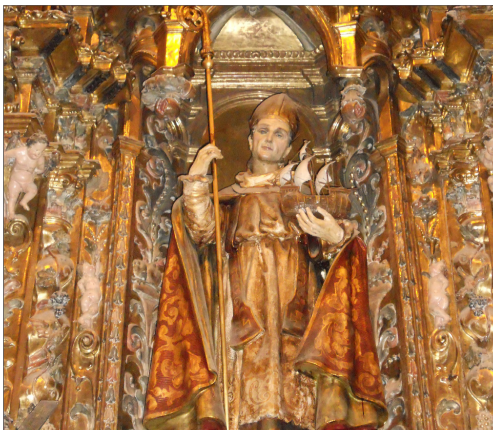
↑ Retaule de Sant Elm. (Església Parroquial de Sitges)