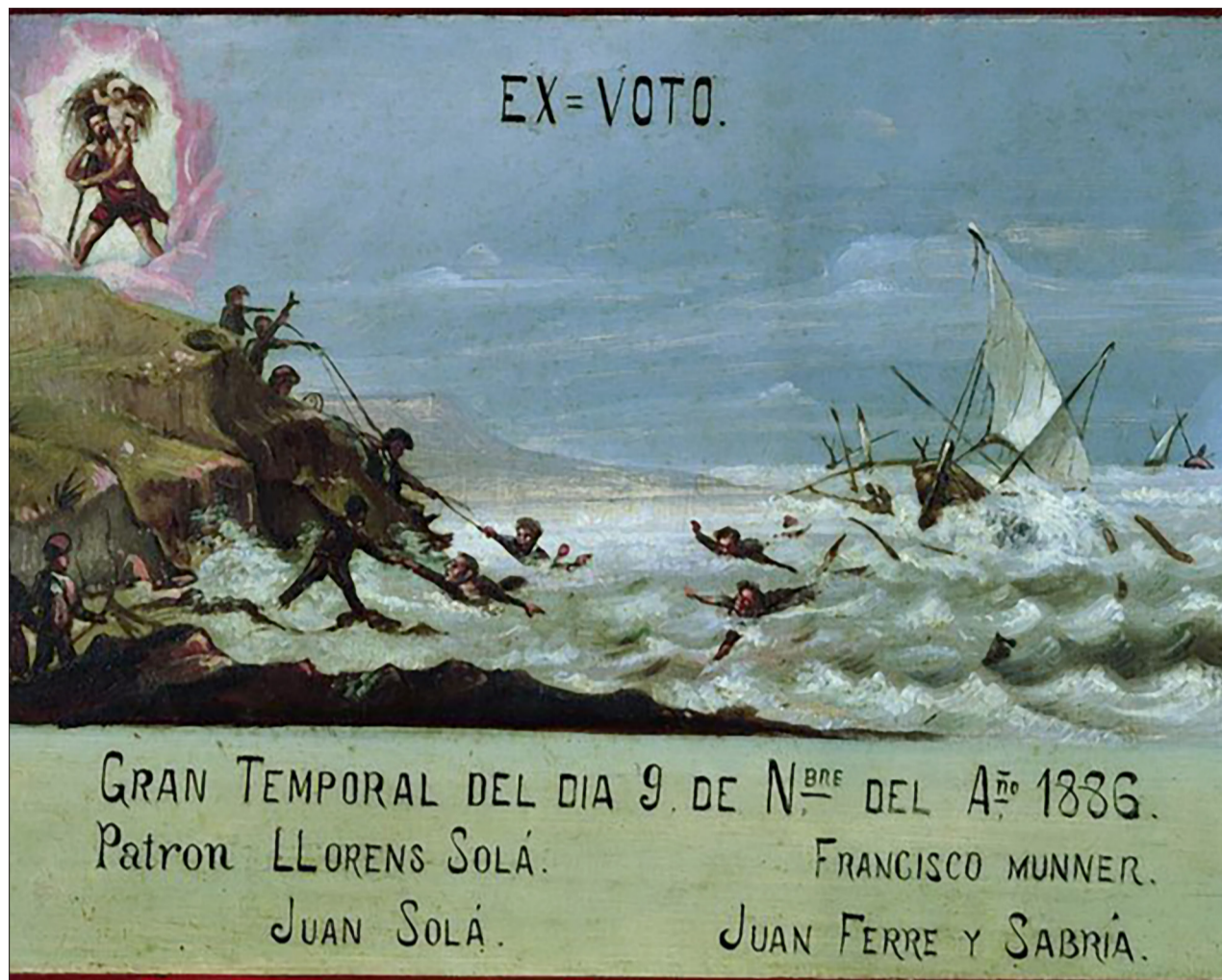
↑ Retauló del temporal conegut com «Any del Negats». Col·lecció de l'ermita de Sant Cristòfol de Vilanova i la Geltrú. (Museu Marítim de Barcelona)

Època de realització: data de l'any 1886; d'autor anònim, fa 36 x 47,5 cm. La tècnica pictòrica utilitzada és oli sobre fusta.