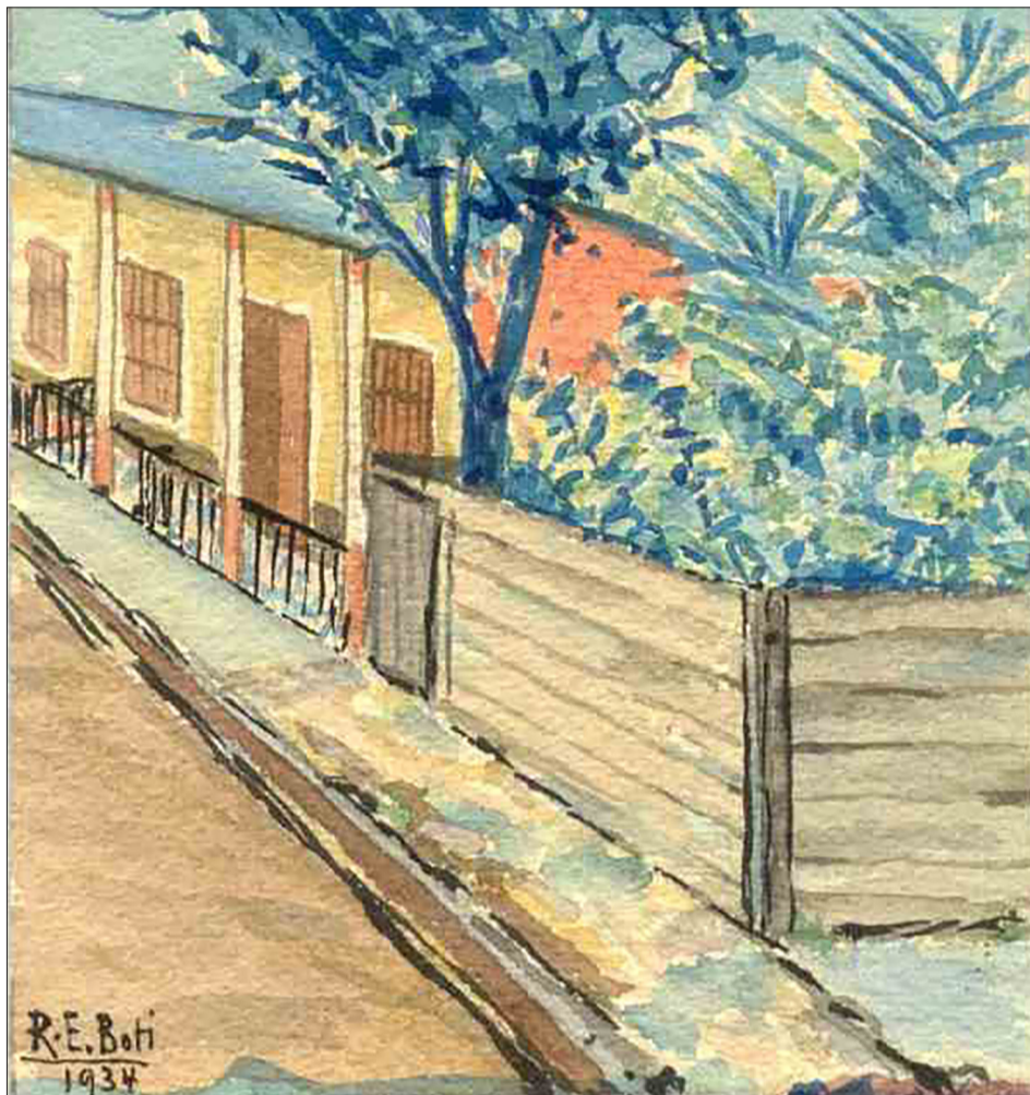
↑ Casa de Gaudenci Boti i Font , pintada per Regino E. Boti l'any 1934 (UNEAC).