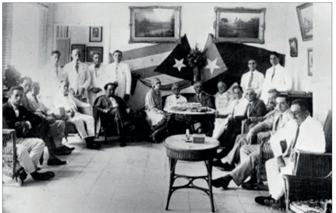
↑ Visita de Francesc Macià i Ventura Gassol l'any 1928 a Guantánamo (Vinyet Panyella. Quadern de Terramar).