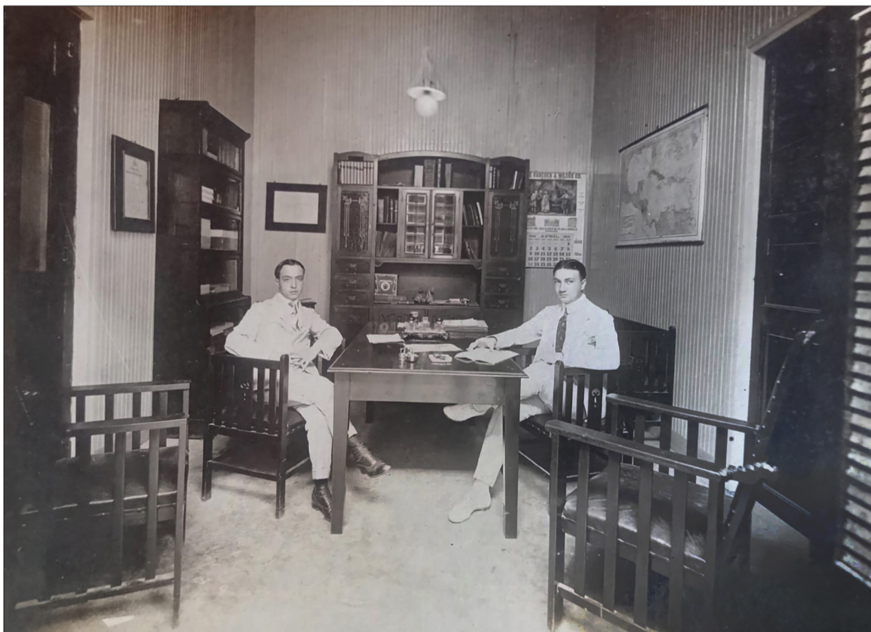
↑ Despatx de la firma C.Bergnes i Cía.