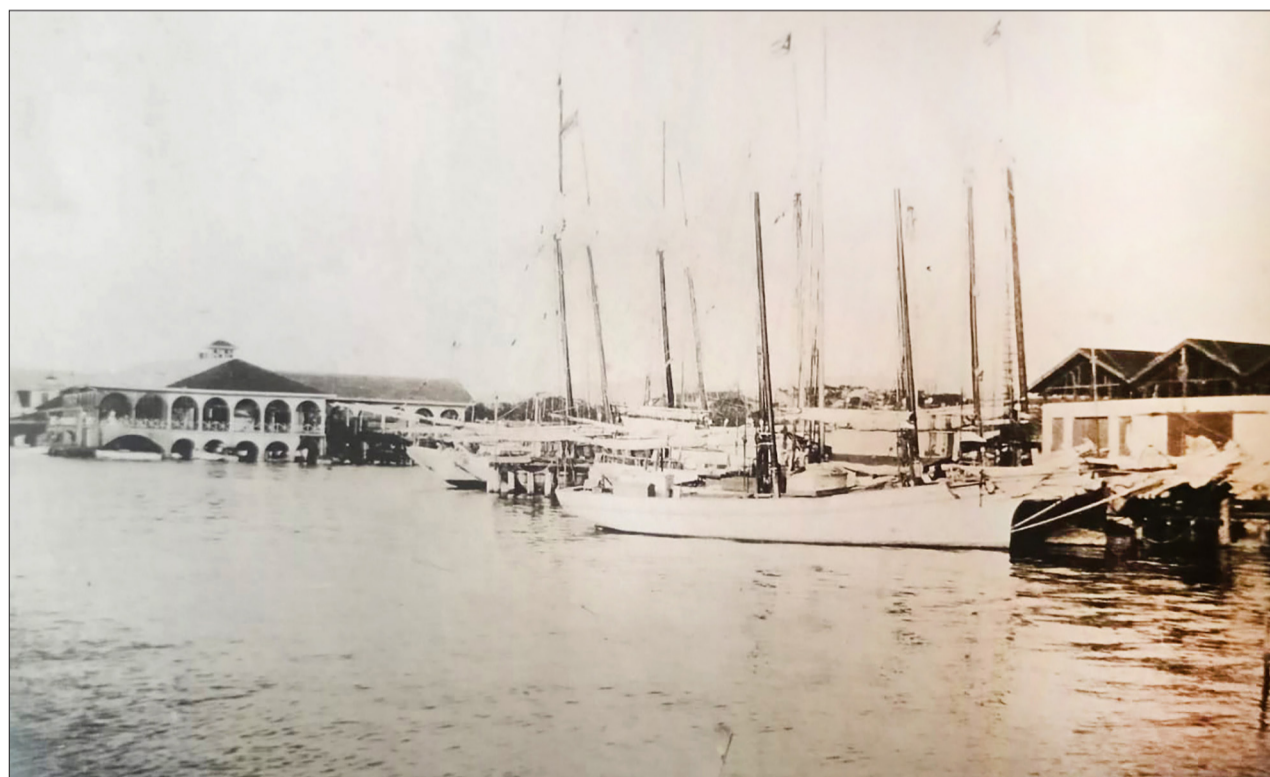
↑ Port de Caimanera (Badia de Guantánamo).