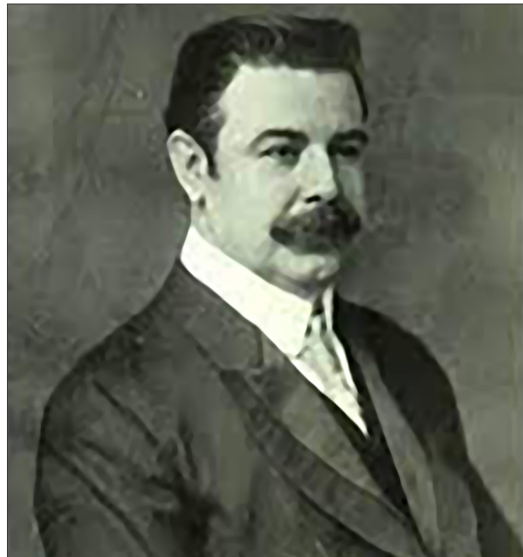
↑ Retrat de Josep Marimón i Juliachs.

El poblat incipient prengué el nom de Saltadero, degut als salts d'aigua del riu Guaso que era navegable. A les construccions primitives en seguiren d'altres més avantatjades. Aparegueren les primeres botigues de queviures i de robes, i els primers trapiches de canya -el «Central Santa Maria» i el «San Ildefonso»- moguts per la força hidràulica.