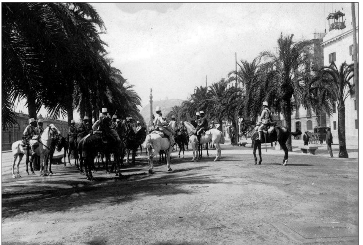
↑ A dalt, coneguda fotografia, feta des de Montjuïc el dia 27 de juliol, on es veuen les fumes de les esglésies incendiades. A baix, al passeig de Colom, soldats de cavalleria enviats a Barcelona. Domini Públic.