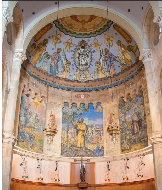
↑ Absis de l'església de Sant Jaume, a Moja, amb les pintures d'Agustí Ferrer Pino

En tot cas, les pintures actuals, realitzades l'any 1941, estan emplaçades en el mateix lloc de l'absis de l'església, i respo-