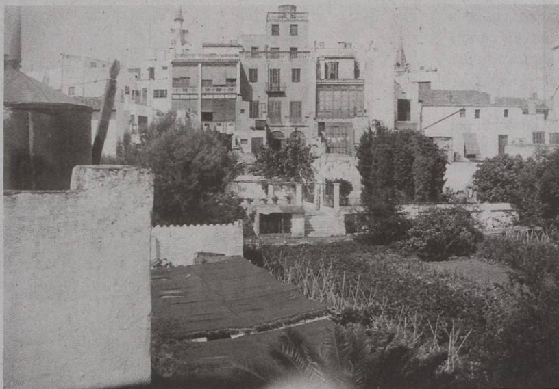
L'hort de Can Falç convertit en sínia poc abans de la seva transformació en parc

de Salvador Casas i Bosc, notari de Barcelona (anotació al marge "vuy Emanuel Fals") afronta a l'E amb la muralla nova de la vila, al S amb les eixides de varies cases veïnes de la Ribera, a l'O i al N amb Joan Pujol, pagès hisendat del Cap de la vila